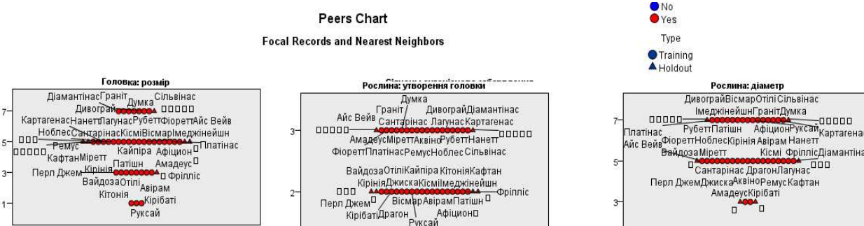
Рис. 3. Фрагменти діаграми квадрантів (Peer Chart) для ознак

Приклад діаграми квадрантів (Peer Chart) наведено на рисунку 3. Ця діаграма унаочнює виведення фокусних спостережень та їх k найближчих сусідів на діаграмі. Діаграма розбита на панелі за показниками.