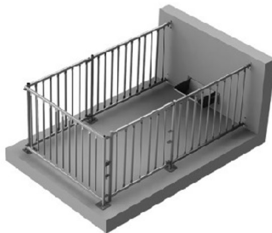
Рис. 2. Удосконалений станок для індивідуального утримання кнура-плідника

Для кнурів термінальних ліній нами було удосконалено індивідуальний станок (рис. 2) [1–6]. Його характеристика була змінена тому, що параметри кнурів були більшими за загальноприйнятий стандарт, що неприйнятно для утримання в станках, які запровадженні для усіх інших кнурів. Характеристика удосконаленого станка: площа підлоги збільшена до 7,8 \text{ м}^2 , висота станка становила 1,65 \text{ м} , прохід становив 3 \text{ м} , висота кріплення годівниці – 95 \text{ см} .