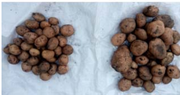
Рис. 2. Різниця в масі між контрольними зразками картоплі і УФ-опроміненими (зліва – контрольний зразок, справа – УФ-опромінений)

Також слід зазначити, що вегетаційний період рослин з опроміненими клубнями картоплі пройшов на 12–14 днів раніше в порівнянні з контрольними зразками. Після збору врожаю середня маса клубнів картоплі була більшою в опромінених зразках в порівнянні з контрольним варіантом (рис. 2), при цьому їх кількість також була більшою. Це має суттєве значення в первинному насінництві картоплі. Збільшення врожаю в разі УФ-опромінення клубнів картоплі перед садінням становило в 2016 році 15 %, а в 2017 році – 12 %.