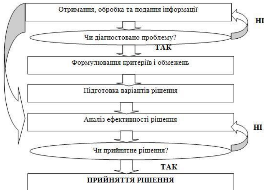
Рис. 3. Механізм прийняття управлінських рішень державним вищим навчальним закладом на основі результатів аналізу