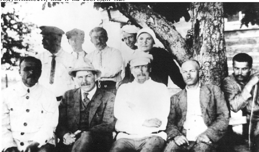
Рис. 4. Академік М.І. Вавилов та наукові співробітники Полтавської сільськогосподарської дослідної станції (у першому ряду другий зліва М.І. Вавилов, у другому перший зліва – професор О.П. Бондаренко)

Коли в 1930 році в Полтаві організовується Всесоюзний науково-дослідний інститут свинарства з філіалами в Мінську, Новосибірську і Тбілісі та мережею дослідних станцій зі свинарства, О.П. Бондаренко стає його першим науковим директором і завідувачем відділу годівлі свиней. Важливим етапом роботи цього закладу була розробка єдиної програми та єдиної методики досліджень у галузі свинарства для всієї мережі дослідних установ СРСР.