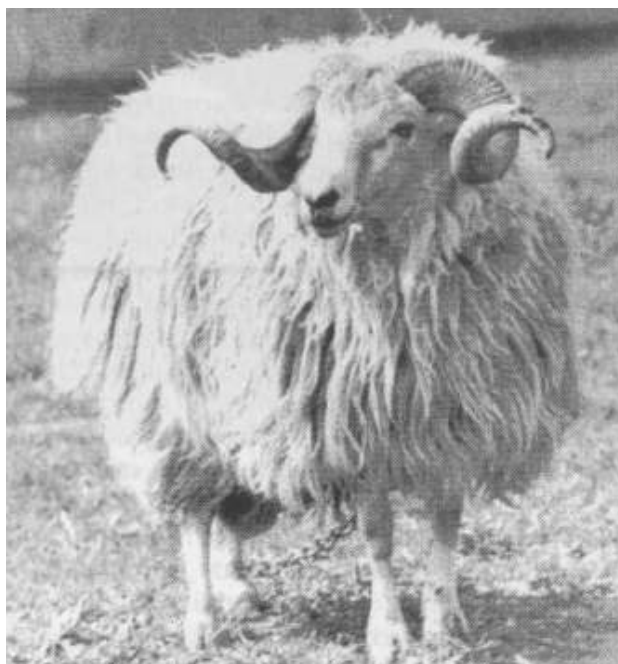
Рис. 1. Сокільська порода овець