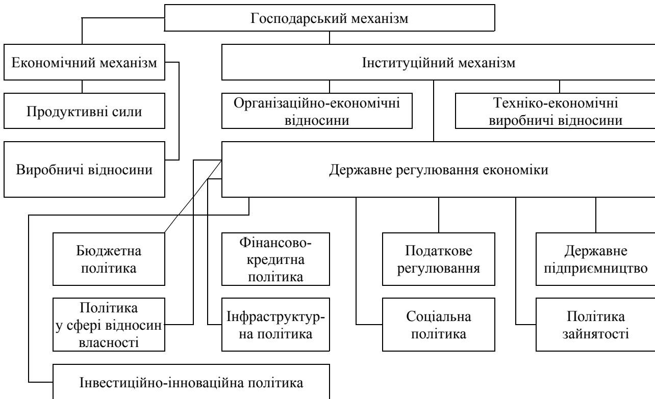
Рис. 1. Схема взаємозв'язків складових господарського механізму [2]

У відповідній літературі механізми трактується як система, пристрій, спосіб, що впливають на порядок певного виду діяльності [4]. За визначенням С.В. Мочерного, господарський механізм – «це система основних форм, методів та інструментів використання економічних законів, розв'язання протиріч суспільного способу виробництва, реалізації власності, а також всебічного розвитку людини, формування її потреб, створення системи стимулів та узгодження економічних інтересів