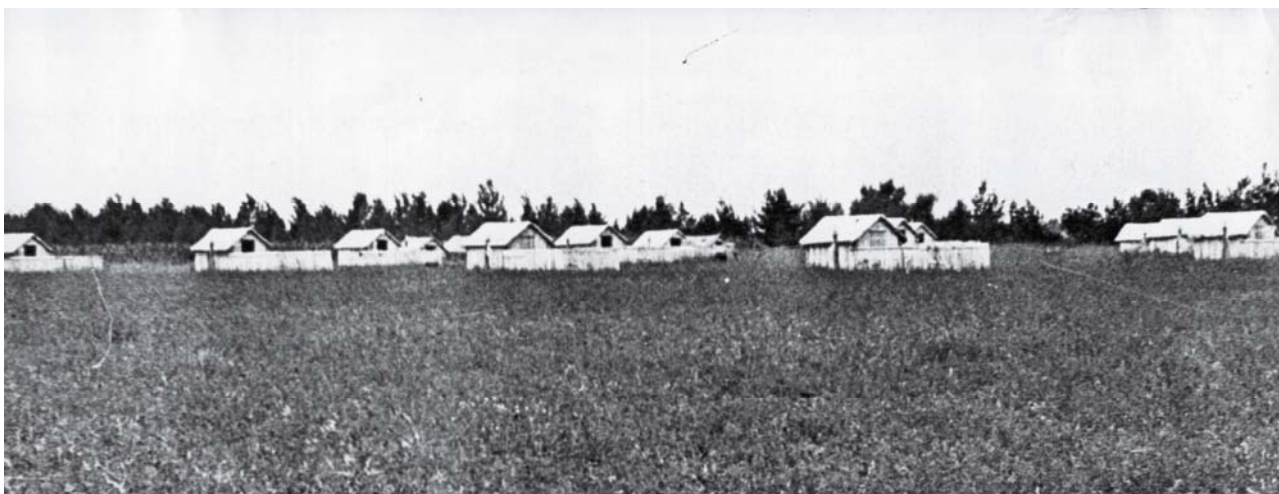
Рис. 2. Літній табір для свиней із будиночків та вигульних двориків біля них для ізольованого утримання свиноматок із поросятами

Збудниками ІАР вчені ЗНДВС вважали Pasteurella multocida і Bordetella bronchiseptica . Їх морфологічні особливості наведені на рис. 3 та 4.