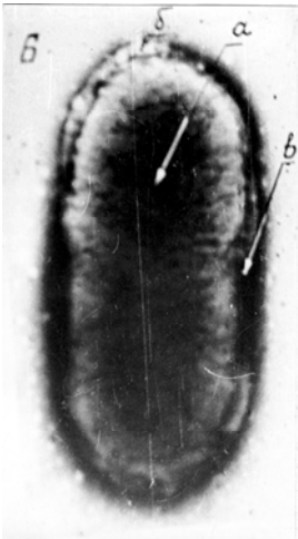
Рис. 3. Клітина Pasteurella multocida з одноклонової культури на МПА під електронним мікроскопом. Зб. x 63000