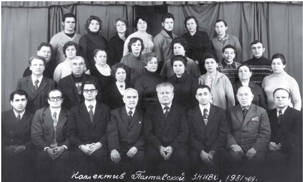
Рис. 5. Колектив Полтавської ЗНДВС 1981 року