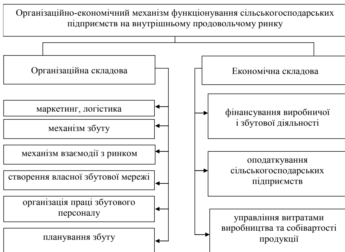
Рис. 3. Складові елементи організаційно-економічного механізму функціонування сільськогосподарських підприємств на внутрішньому продовольчому ринку

Таким чином, розглянуті визначення дозволяють узагальнити складові елементи організаційно-економічного механізму функціонування сільськогосподарських підприємств на внутрішньому продовольчому ринку (рис. 3). У свою чергу, організаційна складова включає маркетинг і логістику, механізм збуту та взаємодії з ринком, створення власної збутової мережі, організацію праці збутового персоналу, планування збуту. Економічний механізм включає фінансування виробничої і збутової діяльності, оподаткування сільськогосподарських підприємств, управління витратами виробництва та собівартості продукції.