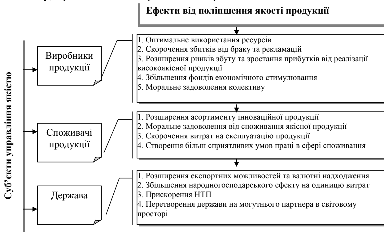
Рис. 3. Ефекти від поліпшення якості продукції

кані чинниками цивільно-правових стосунків, ефекти викликані чинниками ринкового регулювання, ефекти викликані можливістю вдосконалення моделі бізнесу, ефекти викликані фінансовою привабливістю.