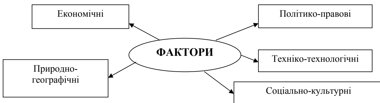
Рис. 3 Фактори розвитку малого і середнього бізнесу

Також нами було проаналізовано безліч факторів, які впливають на діяльність та розвиток малого і середнього бізнесу. Ми пропонуємо об'єднати їх в п'ять основних груп: економічні, політико-правові, техніко-технологічні, соціально-культурні та природно-географічні (рис 3).