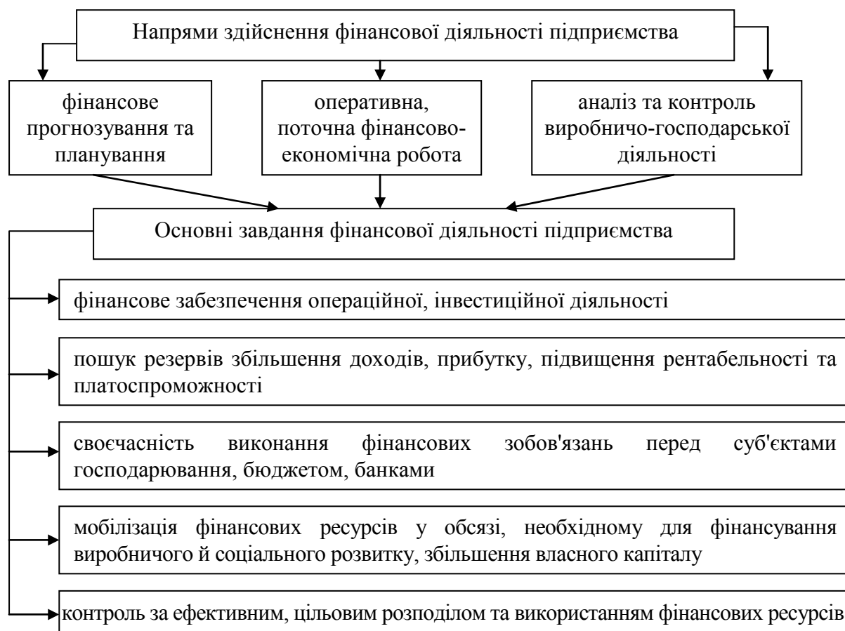
Рис. 1. Основні завдання та напрями здійснення фінансової діяльності сільськогосподарського підприємства

За ринкових умов аграрне підприємство самостійно визначає напрямки та розмір використання прибутку, який залишається в його розпорядженні після сплати податків. Метою складання фінансового плану є визначення фінансових ресурсів, капіталу та резервів на підставі прогнозування величини фінансових показників: власних оборотних коштів, амортизаційних відрахувань, прибутку, суми податків. Підприємства, плануючи витрати на виробництво та реалізацію сільськогосподарської продукції, неодмінно слід урахувувати резерви зниження її собівартості, до яких належать: поліпшення використання основних виробничих засобів та збільшення у зв'язку з цим випуску продукції на кожен гривню основних засобів; раціональне використання сировини, матеріалів, палива, енергії та скорочення витрат на одиницю продукції без зниження її якості; зменшення затрат живої праці на одиницю продукції на основі науково-технічного прогресу; скорочення витрат на реалізацію продукції за рахунок удосконалення форм її збуту; зменшення втрат від браку та безгосподарності, ліквідація непродуктивних витрат; економія в адміністративно-управлінській сфері на підставі раціональної організації апарату управління підприємством [4, с.121].