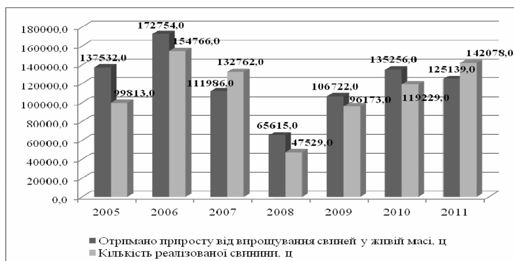
Рис. 1. Динаміка обсягів приростів та реалізації свинини сільськогосподарськими підприємствами Харківської області у 2005-2011 рр. *

Гістограма демонструє ситуацію по різкому скороченню реалізації свиней у кризовому 2008 році, однак, починаючи із 2009 року відбувається поступове їх нарощування.