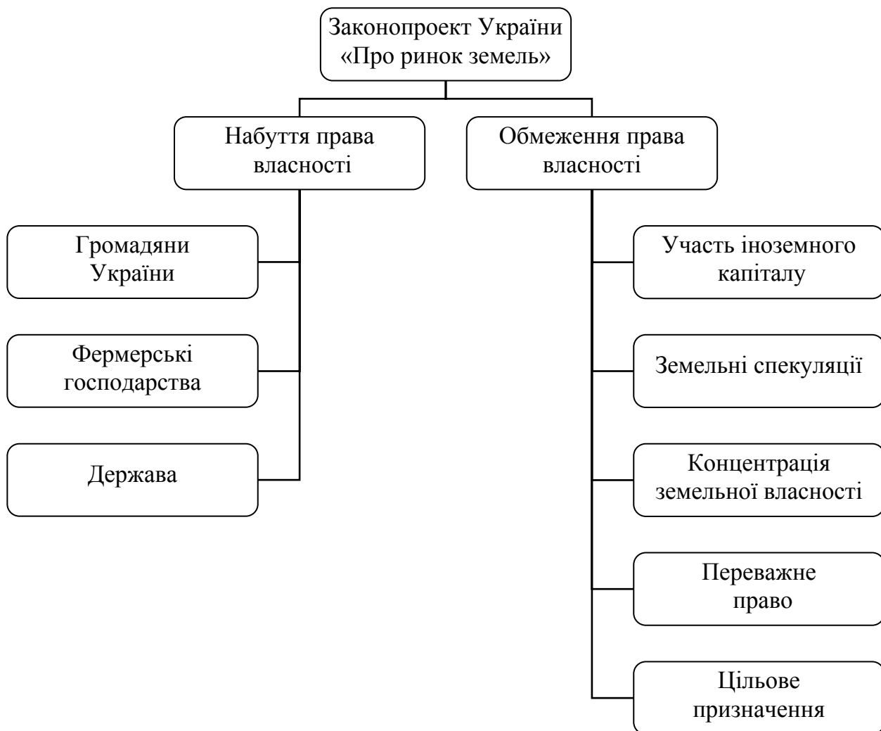
Рис. 2. Регулювання права власності згідно законопроекту України «Про ринок земель»