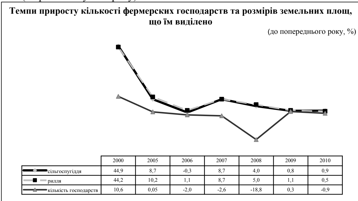
Рис. 3. Темпи приросту кількості фермерських господарств та розмірів земельних площ, що їм виділено у АР Крим за 1995-2011 рр.

У 2010 р. фермерами вироблено більш 11 % усього обсягу зерна, 15 % – насіння соняшника (в 2009 р. – відповідно 13 % і 8 % загального валового збору), 0,8 % – овочів (проти 1,1 %), 0,3 % – фруктів (0,7 %), 0,1 % – винограду (проти 0,2 % в 2009 р.), 0,4 % – м'яса в забійній вазі (0,5 %), 0,4 % – молока (на рівні минулого року).