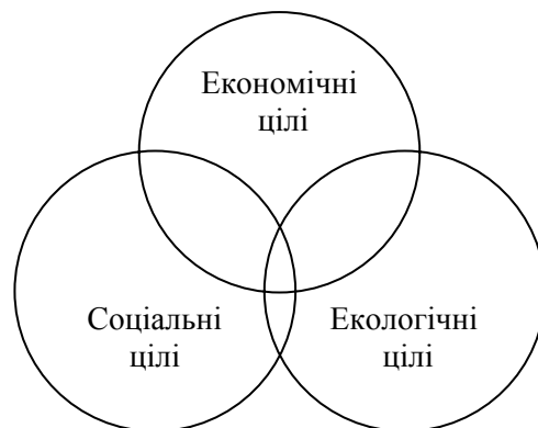
Рис. 1. Поєднання економічних, соціальних і екологічних цілей в моделі стійкого розвитку

Не випадково для графічного зображення стійкого розвитку звичайно використовуються геометричні фігури, які тією чи іншою мірою нагадують тріади: трикутник (де вершини символізують три базові сфери, а сторони між ними відповідають проміжним підсферам) чи сполучення трьох пересічних окружностей (рис. 1).