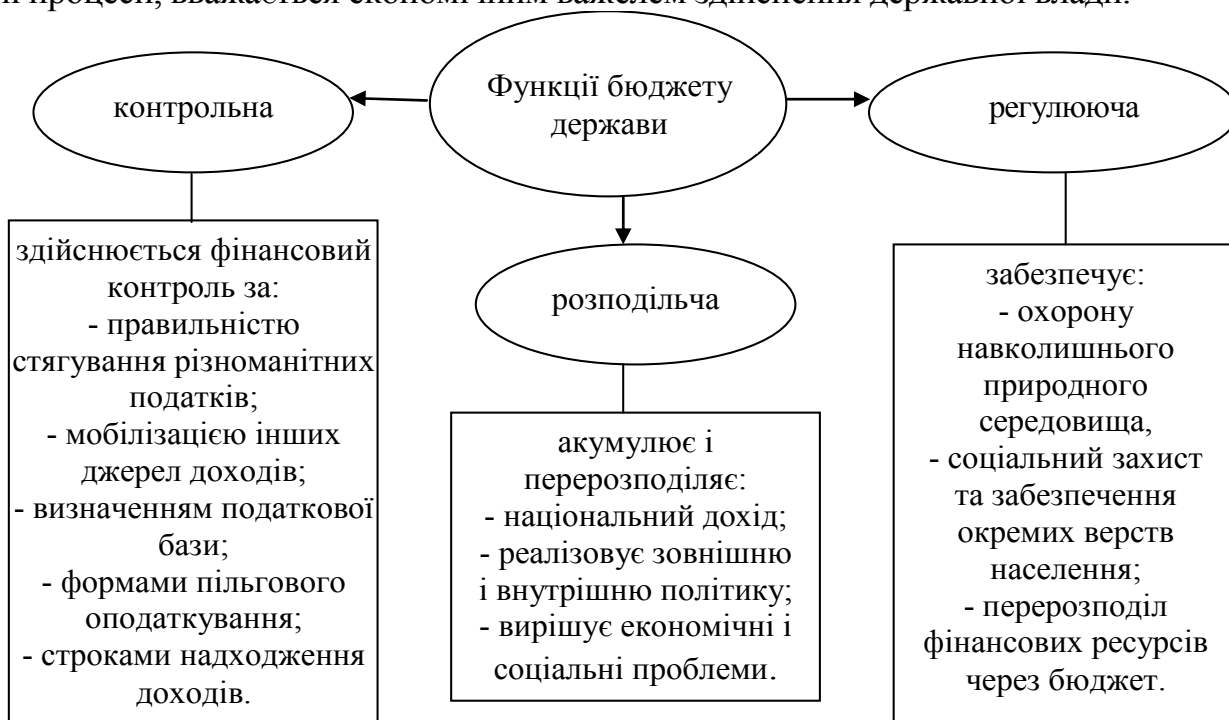
Рис. 1. Основні функції бюджетного процесу

Суть розподільчої функції бюджету полягає в тому, що він акумулює і перерозподіляє значну частину фінансових ресурсів держави, в тому числі національний дохід, що дає змогу державним органам влади реалізувати зовнішню і внутрішню політику, вирішувати відповідні економічні і соціальні проблеми. Саме розподільча функція дозволяє державі централізувати грошові кошти і використовувати їх з метою задоволення загальнодержавних потреб. Бюджет, виконуючи розподільчу функцію, виступає гарантом держави у розподілі бюджетних коштів, впливає на економічні, соціальні, національні, регіональні процеси, вважається економічним важелем здійснення державної влади.