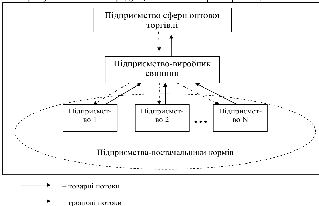
Рис. 2. Пропонована схема взаємодії учасників вертикального інтеграційного об'єднання на внутрішньому ринку продукції свинарства*

сові можливості цих суб'єктів ринку ми пропонуємо залучати їх капітал у виробництво шляхом участі в інтеграційних об'єднаннях (рис. 2). В свою чергу, варто відмітити, що в більшості випадків товаровиробник немає належного обсягу грошових коштів для підтримання повноцінного циклічного процесу виробництва, а тому наявність інвесторів є вкрай необхідною, в ролі яких, на нашу думку, повинні виступити саме вітчизняні посередницькі структури. В подальшому виробник продукції свинарства співпрацює з збитковими господарствами, які займаються виробництвом продукції рослинництва. Безпосередньо виробник укладає договір з підприємством рослинницького напрямку на постачання продукції польового кормовиробництва.