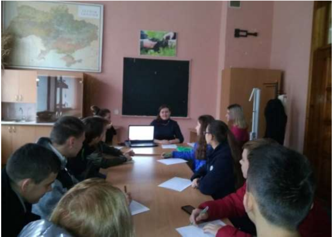
Лабораторне заняття студентів спеціальності 101 Екологія з навчальної дисципліни «Збалансоване використання земельних ресурсів»»