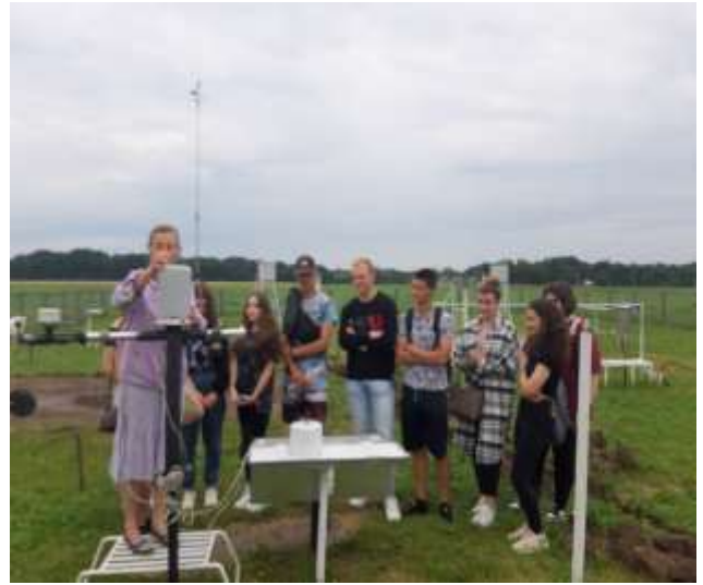
Блок «Метеорологія та кліматологія»