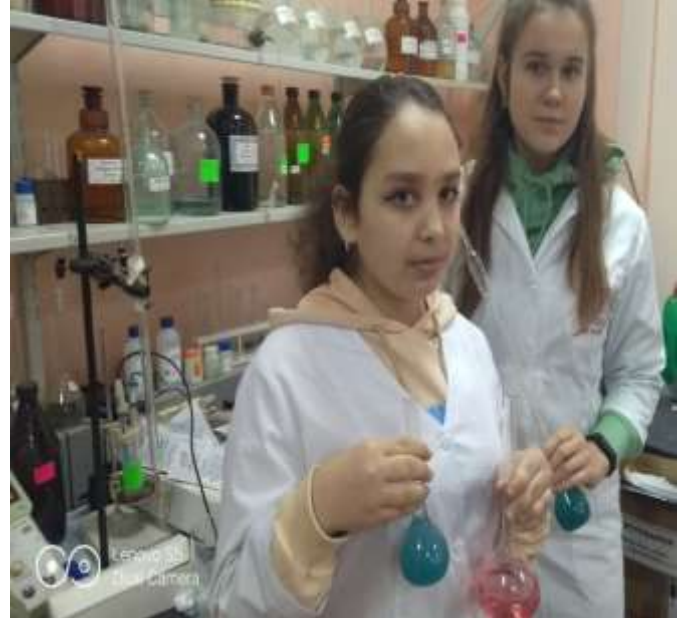
Блок «Екологія ґрунтів»

Комплексна навчальна практика I Здобувачів вищої освіти спеціальності 101 Екологія