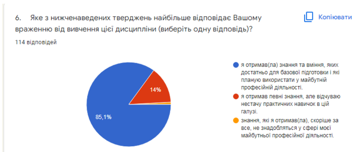
Рис. 7. Розподіл відповідей щодо вражень від отриманих знань

Самооцінка професійної цінності отриманих знань здобувачів вищої освіти достатньо висока (рис. 7):