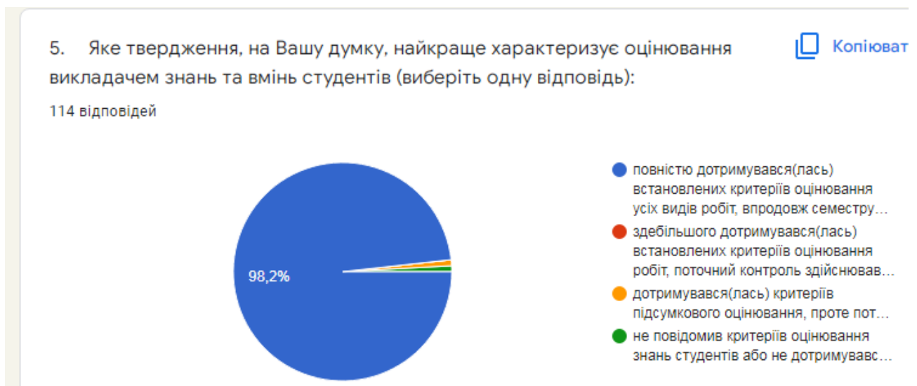
Рис. 6. Розподіл відповідей щодо оцінювання викладачем знань та вмінь ЗВО

– не повідомив(ла) критеріїв оцінювання знань студентів або не дотримувалася(лася) встановлених критеріїв: 1 (0,9 %).