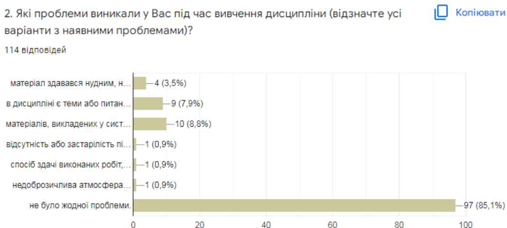
Рис. 3. Розподіл відповідей здобувачів вищої освіти щодо проблем, які виникали під час вивчення дисципліни

На питання щодо проблем, які виникали під час навчання, відповіді розподілилися наступним чином (рис. 3).