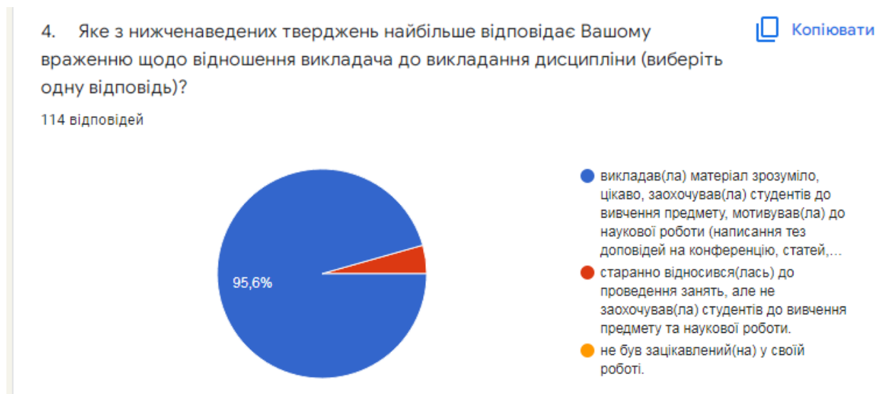
Рис. 5. Розподіл відповідей щодо оцінювання відношення викладачів до викладання

Таким чином, середня оцінка задоволеності рівнем читання лекцій та проведення практичних занять склала 4,8. У динаміці цей показник майже не змінився порівняно із минулим семестром і є вище за позаминулу оцінку 4,6. У середньому за період моніторингу респонденти оцінили рівень лекцій та практичних занять на 4,8 бали, що становить 96 % від максимальної оцінки.