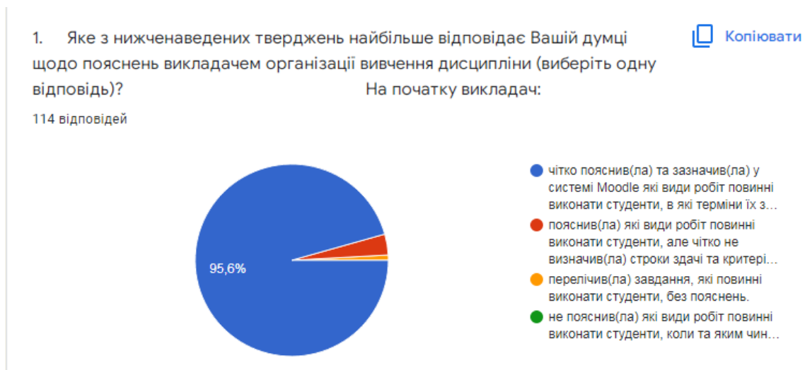
Рис. 2. Розподіл відповідей на питання щодо пояснень викладачем організації вивчення дисципліни

– 0,9 % (1 опитаний) вважає, що «викладач перелічив(ла) завдання, які повинні виконати студенти без пояснень».