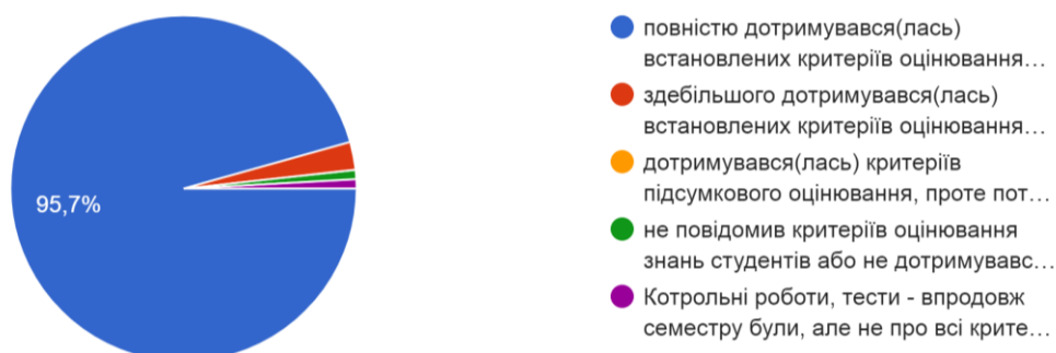
Рис. 4. Розподіл відповідей щодо оцінювання викладачем знань та вмінь студентів

- повністю дотримувався(лася) встановлених критеріїв оцінювання усіх видів робіт, упродовж семестру студенти писали тести або контрольні роботи, здавали самостійні завдання, які оперативно перевірялися: 110 (95,7 %);