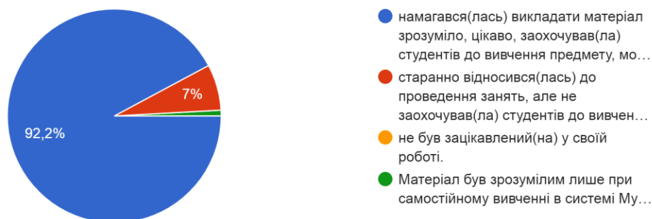
Рис. 3. Розподіл відповідей щодо відношення викладача до викладання дисципліни

Відповіді на питання 5, яке твердження найкраще характеризує оцінювання викладачем знань та вмінь студентів, розподілилися так (рис. 4):