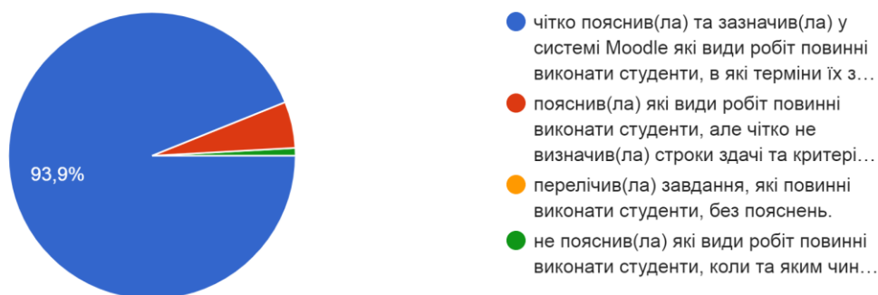
Рис. 1. Розподіл відповідей на питання щодо пояснень викладачем організації вивчення дисципліни

1. Яке з нижченаведених тверджень найбільше відповідає Вашій думці щодо пояснень викладачем організації вивчення дисципліни (виберіть одну відповідь)? На початку викладач: 115 відповідей