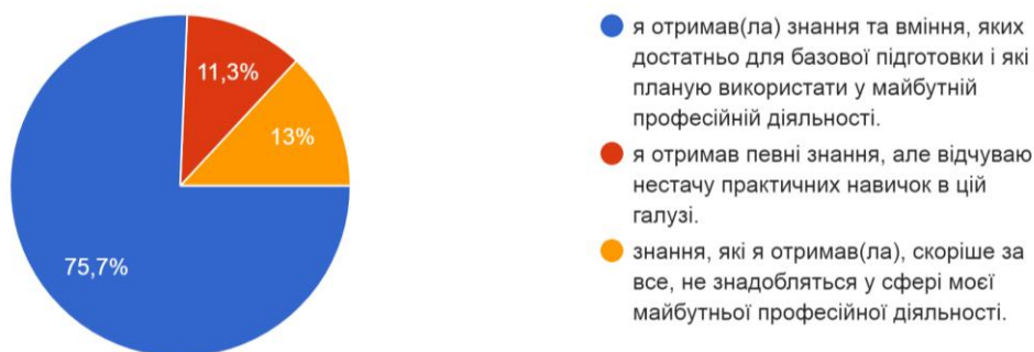
Рис. 5. Розподіл відповідей щодо вражень від вивчення дисципліни

З метою узагальнення задоволеності якістю викладання здобувачами вищої освіти їх відповідям на питання, що не мають числової оцінки, були присвоєні значення за 5-бальною шкалою, наведеною у додатку А.