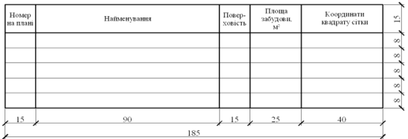
Рис. Е.2. Форма експлікації будівель та споруд на генеральному плані