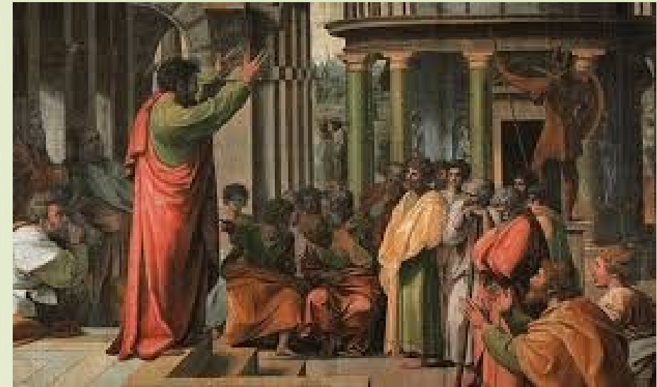
Марк Туллий Цицерон