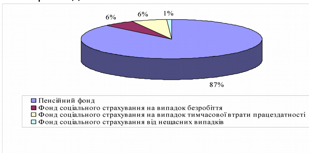
Рис. 2.1. Структура фондів соціального страхування та пенсійного забезпечення

Таблиці. Цифровий матеріал, як правило, повинен оформлятися у вигляді таблиць. Таблицю розміщують після першої згадки про неї в тексті таким чином.