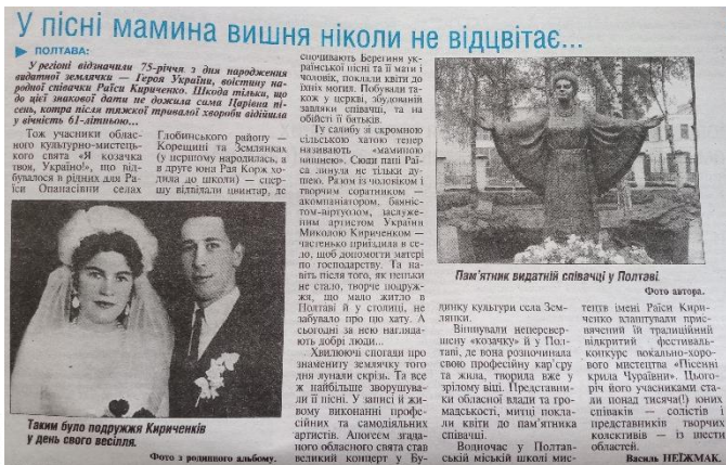
Неїжмак В. У пісні мама вишня ніколи не відцвітає. Голос України. 2018. 20 жовт. С. 9.