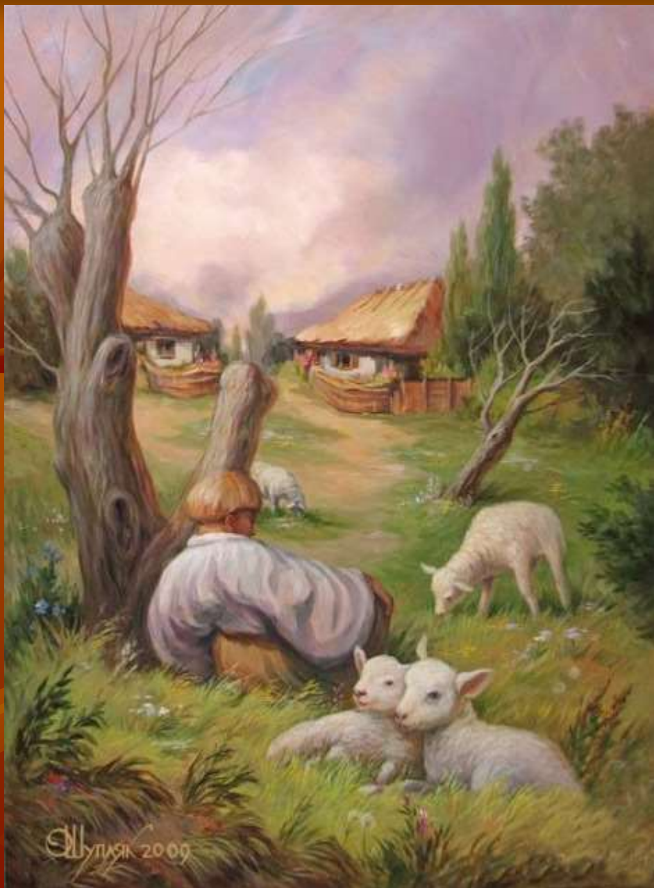
Мені тринадцятий минало