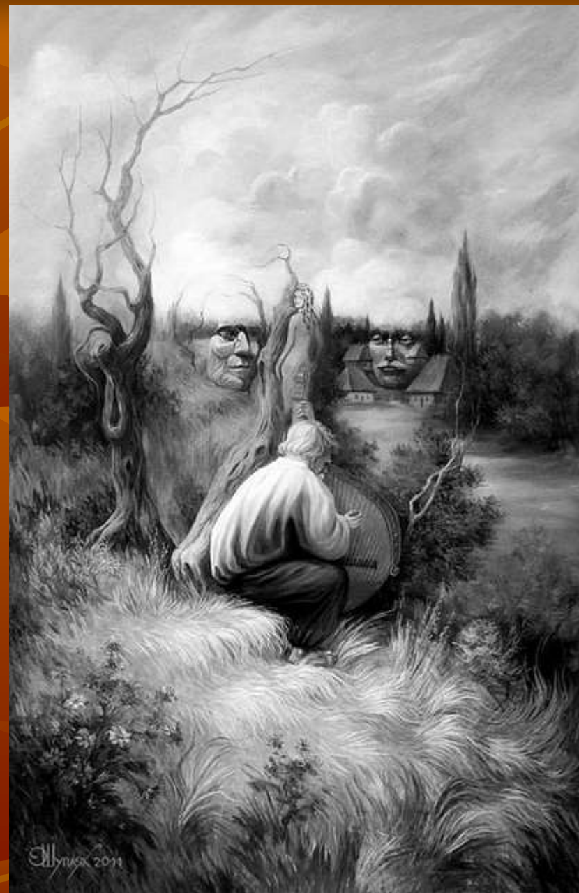
Наша дума, наша пісня