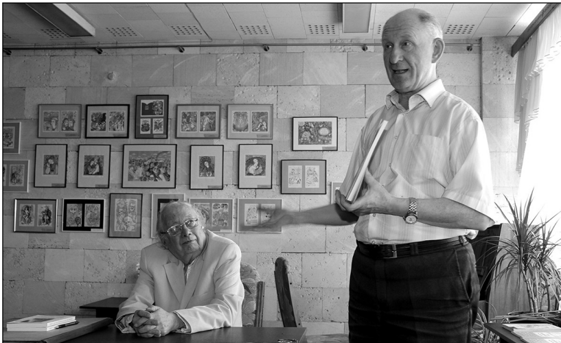
На презентації книги уславленого українського мистецтвознавця, заслуженого працівника культури України Віталія Ханка в бібліотеці. 2018 р.