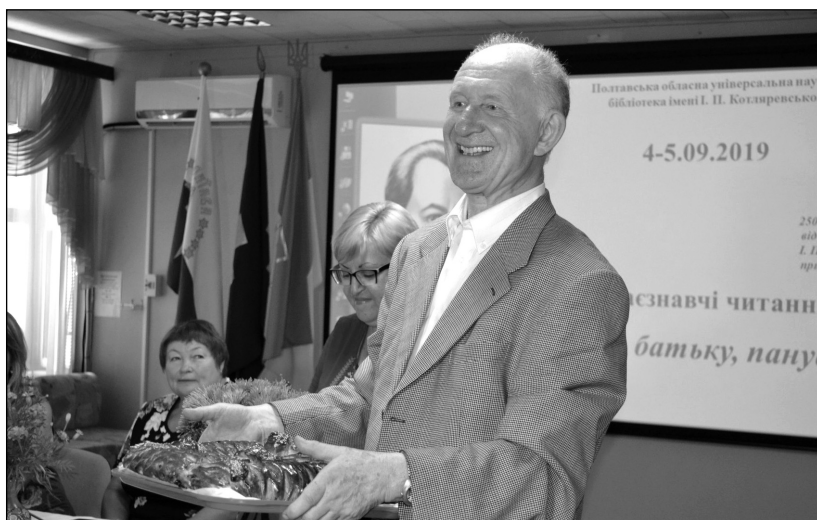
З великою повагою та короваєм на честь піввікового читацького ювілею. 2019 р.