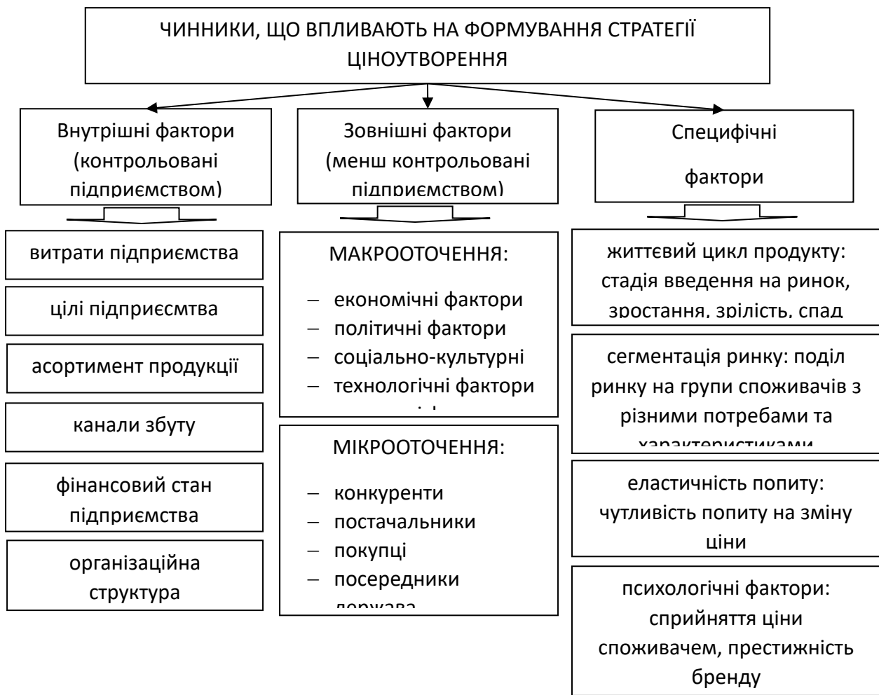
Рис. 1.5. Фактори, що впливають на формування цінових стратегій

Таблиці. Цифровий матеріал, як правило, повинен оформлятися у вигляді таблиць. Таблицю слід розташовувати безпосередньо після тексту, у якому вона згадується вперше, або на наступній сторінці. На всі таблиці мають бути посилання в тексті. Кожна таблиця повинна мати номер і назву. Назву таблиці друкують жирним шрифтом малими літерами (крім першої великої) і розміщують над таблицею симетрично до тексту. Назва має бути стислою і відбивати зміст таблиці.