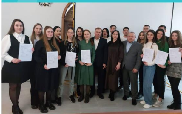
Вручення сертифікатів студентам Вінницького національного аграрного університету

DAAD Förderprogramm: Ukraine digital: Studienerfolg in Krisenzeiten sichern (2022) Projektnummer: 57650509 Kurzbeschreibung: Adapted Life Science – Online-Studium für ukrainische Studierende Verfübar: Wintersemester: 01.10.2022 – 14.03.2023