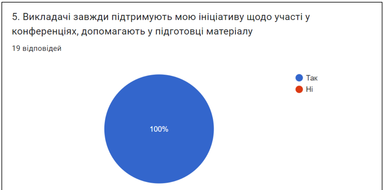
Рис. 5. Оцінка викладачів по підтримці ініціативи щодо участі у конференціях та допомозі у підготовці матеріалу

Майже всі опитуваних ( 94,57% або 18 респондентів) зазначили, що розуміються на видах наукової роботи та знають порядок підготовки матеріалів до участі конференції або подачі тез до друку.