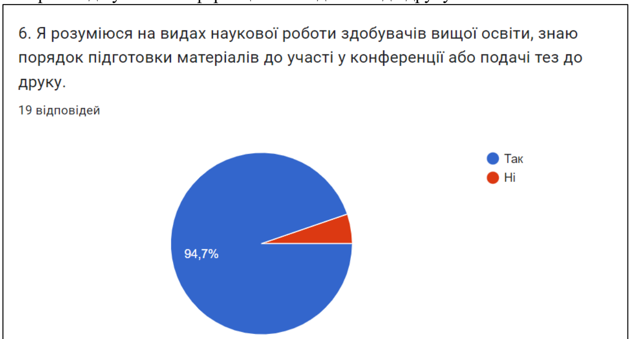
Рис. 6. Рівень обізнаності ЗВО на видах наукової роботи та знань по підготовці матеріалів до участі конференції або подачі тез до друку

Майже всі опитуваних ( 94,57% або 18 респондентів) зазначили, що розуміються на видах наукової роботи та знають порядок підготовки матеріалів до участі конференції або подачі тез до друку.