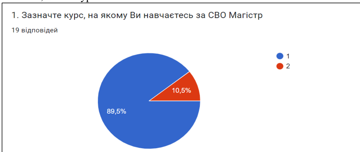
Рис. 1. Структура опитуваних здобувачів вищої освіти

На питання « Я беру участь у наукових міжнародних/ всеукраїнських або щорічних наукових конференціях у ПДАУ» респонденти відповіли наступним чином: