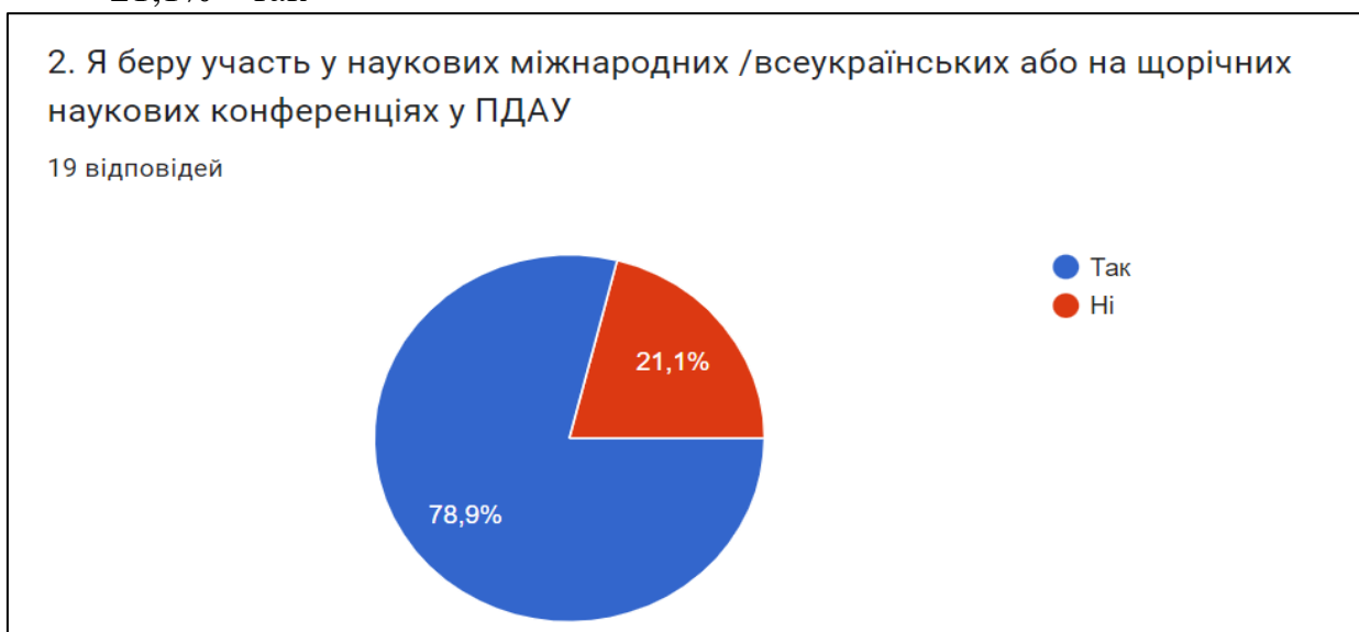
Рис. 2. Оцінка участі ЗВО у наукових міжнародних/ всеукраїнських або щорічних наукових конференціях у ПДАУ