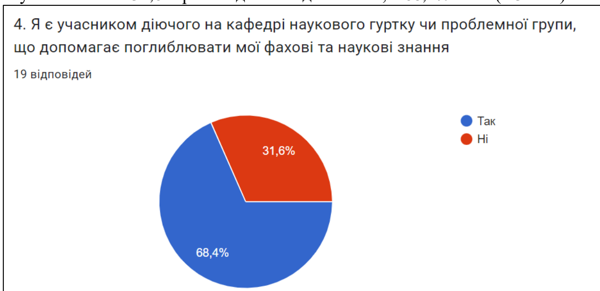
Рис.4. Оцінка діючого на кафедрі наукового гуртку чи проблемної групи, що допомагає поглиблювати мої фахові та наукові знання

При відповіді на питання «Я є учасником діючого на кафедрі наукового гуртку чи проблемної групи, що допомагає поглиблювати мої фахові та наукові знання» 31,6% респондентів відповіли ні, а 68,4% - так ( 13 осіб).