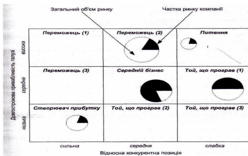
Рисунок 2. - Матриця GE «Привабливість галузі – конкурентна позиція»

Максимальна оцінка привабливості галузі може бути 5, а мінімальна - 1 (чи 10 і 1 відповідно).