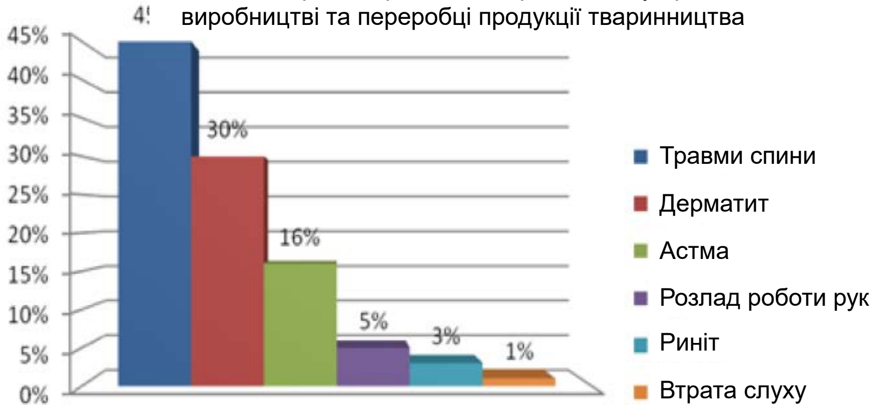
Моніторинг виробничого травматизму при виробництві та переробці продукції тваринництва

Процент професійних захворювань при виробництві та переробці продукції тваринництва