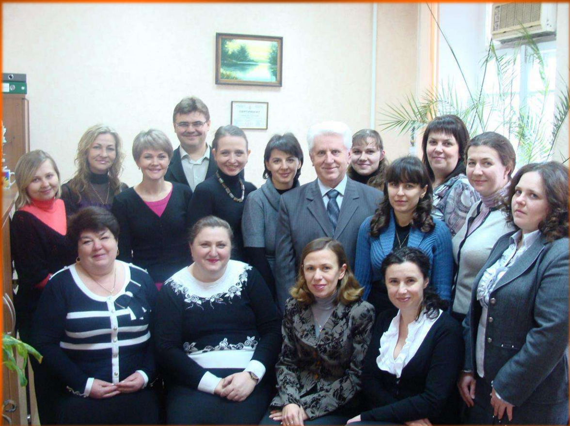
Колектив кафедри організації обліку і аудиту, 2012 рік.

Оскільки у липні 2002 року було зафіксовано збільшення попиту на професію бухгалтера та відповідно збільшилися контингент студентів і професорсько-викладацький склад, відбулася реорганізація кафедри бухгалтерського обліку і аудиту, внаслідок якої утворилося дві кафедри – бухгалтерського обліку та організації обліку і аудиту (остання функціонувала як самостійний структурний підрозділ факультету обліку та фінансів до 2019 року).