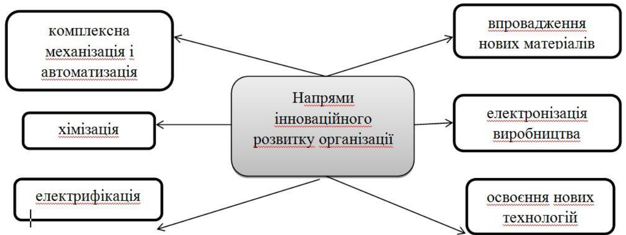
Рис. 2 Напрями інноваційного розвитку організації

Скорочення кількості інноваційних підприємств є наслідком ряду проблем, що накопичилися в українській економіці та в сфері НДКР зокрема: