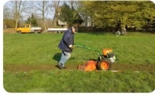
Park grasslands in Münster, Germany