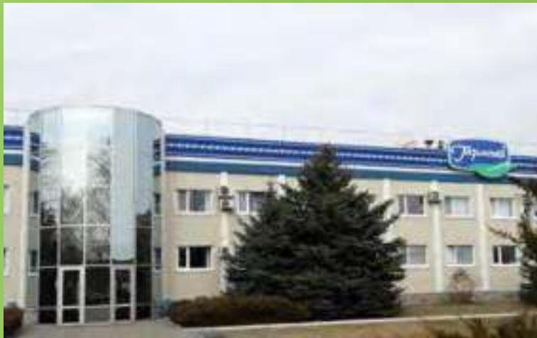
Лубенський молочний завод Полтавська обл. м. Лубни вул. Індустріальна, 2