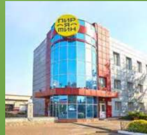
Пирятинський сирзавод Полтавська область, Пирятинський район, місто Пирятин, вулиця Сумська, будинок 1