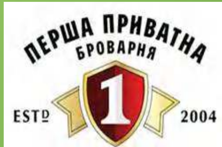
Перша приватна броварня м. Львів, вул. Вашингтона, 10